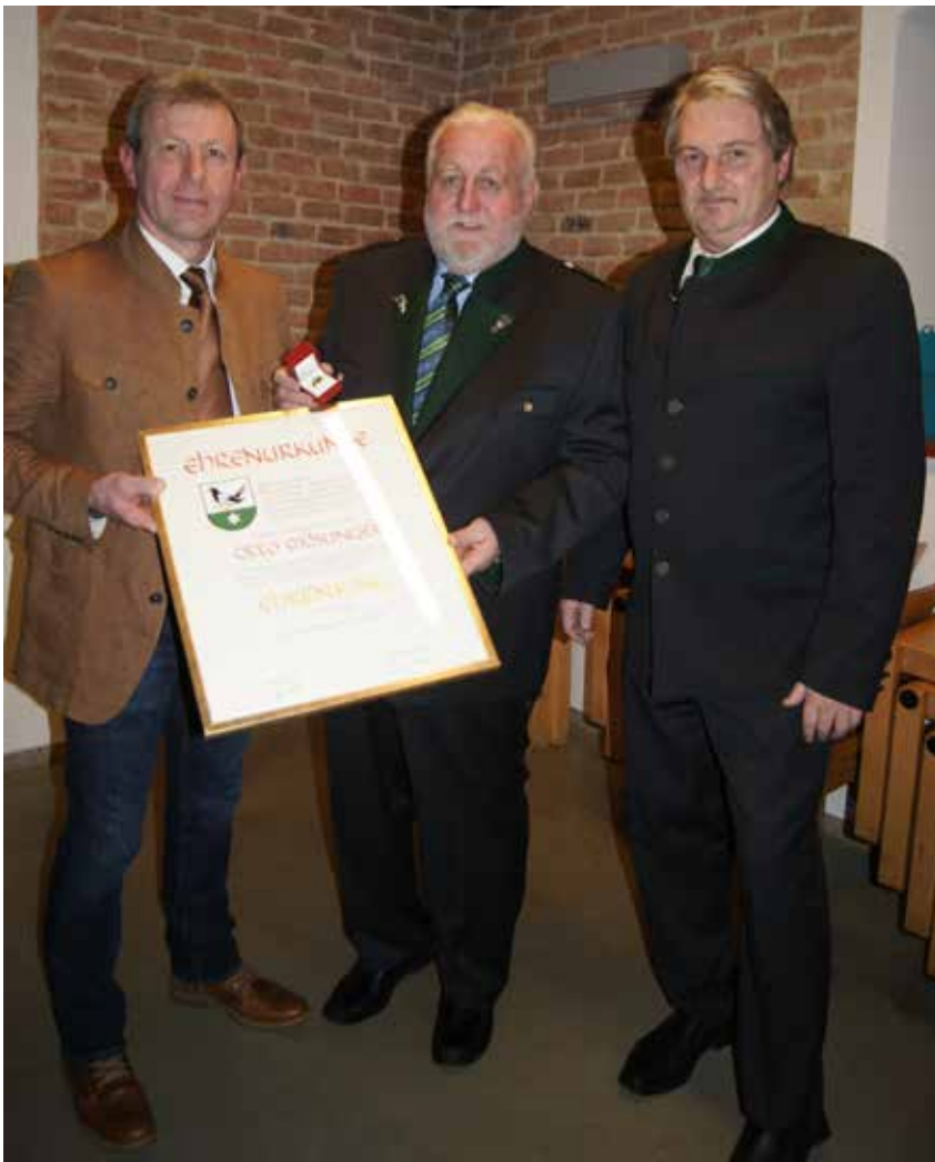
Übergabe des Ringes und der Urkunde