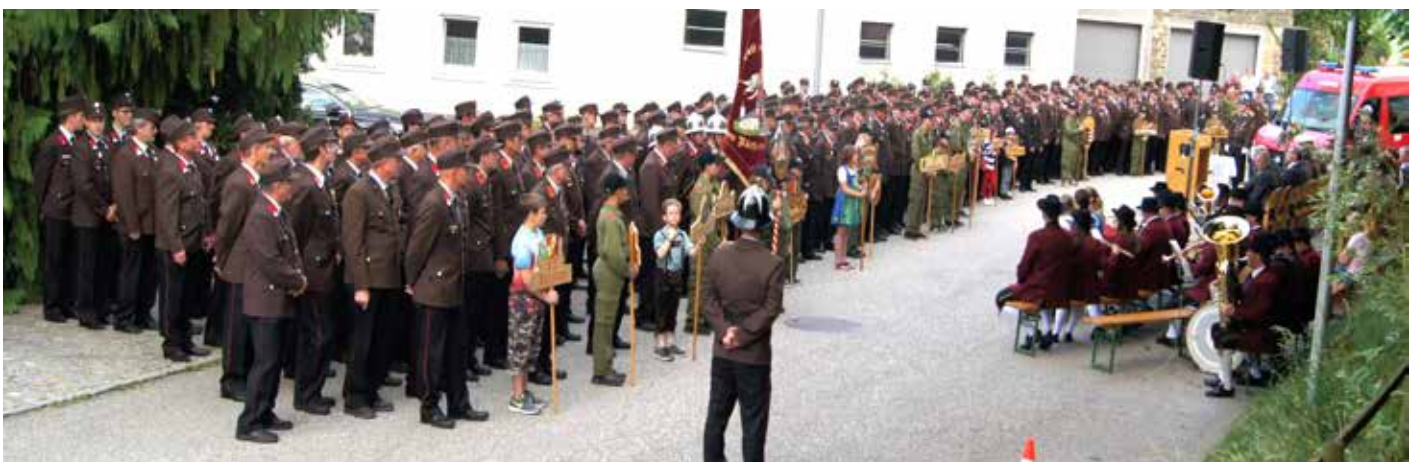
23 Feuerwehren kamen zur Segnung des neuen Fahrzeuges