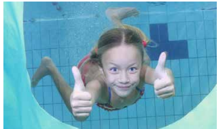
Damit beim Baden alles gut geht

• Im Wasser aufzustehen kann für Kleinkinder zum Problem werden. Durch