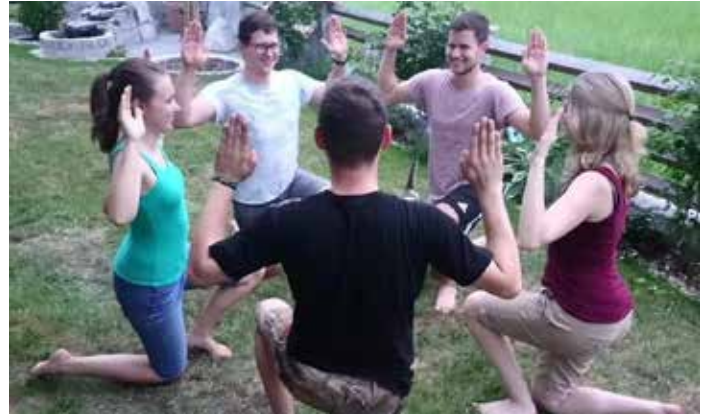
Die Plattlergruppe übt fleißig