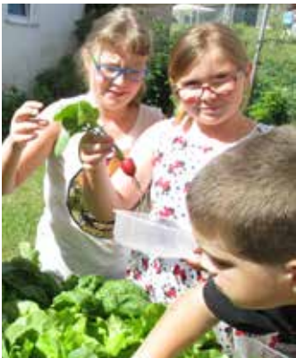
Gemüse wird im Biogarten geerntet