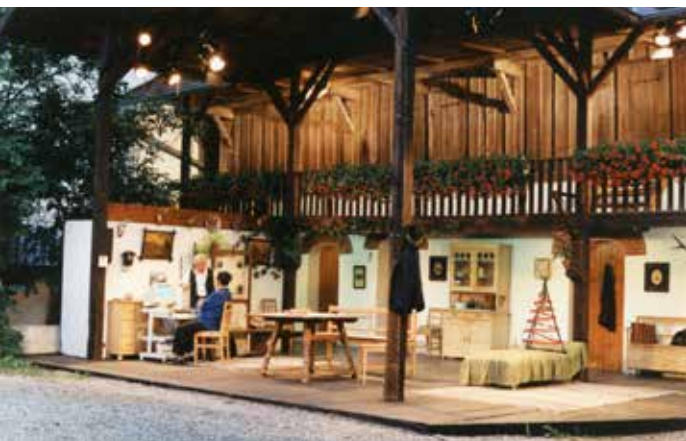
Theater am Bauernhof