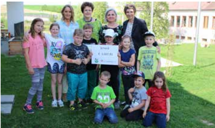
Übergabe des Schecks