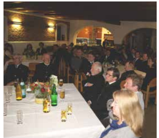
Zahlreiche Gäste erschienen zur Ehrung