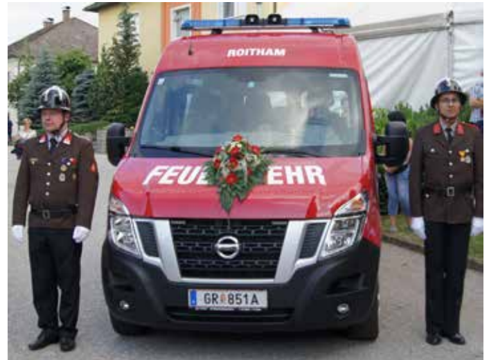
Neues MTF der FF Roitham

Mit diesem Mannschaftstransportfahrzeug haben wir jetzt wieder ein, dem Stand der Technik, entsprechendes Einsatzfahrzeug. Mit diesem MTF können wir jetzt wieder beruhigt unsere Bewerbungsgruppe zu den Bewerbungen schi-