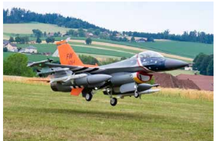
Modellflugshow in Meggenhofen