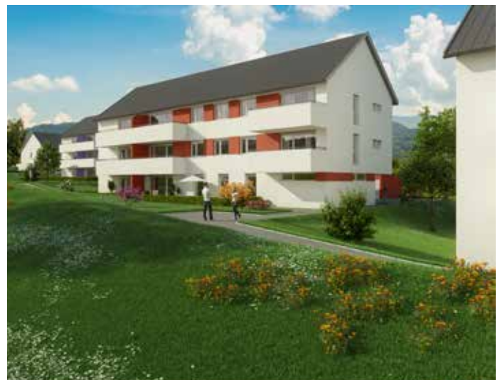
Neue Wohnanlage in Meggenhofen