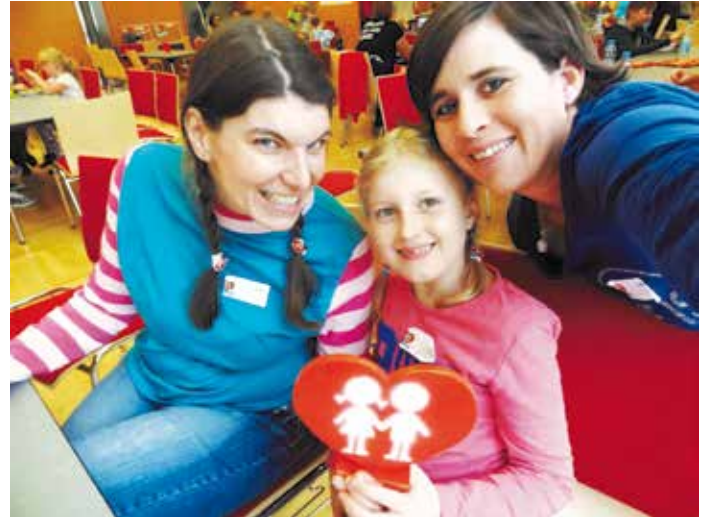
Neuer Verein: Kinderfreunde Meggenhofen