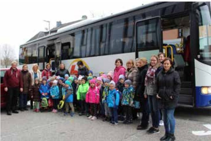
Alle Kinder freuten sich über den Kindergartenausflug

So heißt ein Bewegungsprojekt der AUVA. Dieses kostenfreie Angebot für unsere Kinder des Kindergartens zum Thema Bewegung und Gesundheit nahmen wir gerne in Anspruch und mit einem bis auf den letzten Platz gefüllten Bus fuhren wir am 17.11.2017 nach Linz ins Volksheim Neue Heimat.