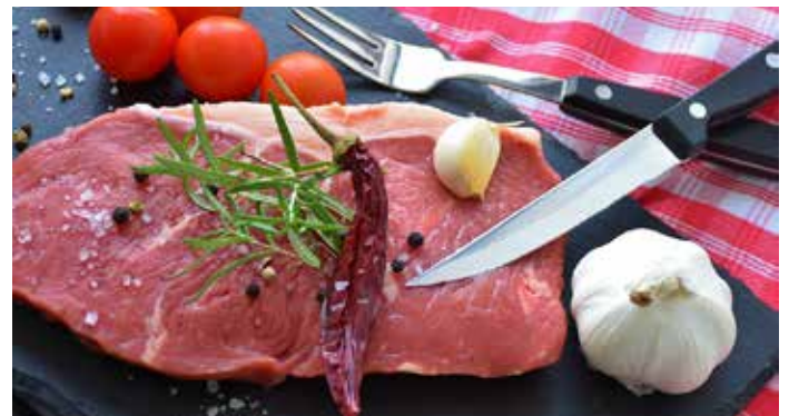
Richtiges Kochen will gelernt sein!