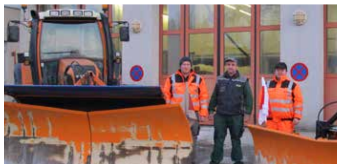
Der Bauhof ist für den Winterdienst gerüstet.

Die Gemeinde ersucht um Kenntnisnahme und hofft, dass durch ein gutes Zusammenwirken der kommunalen Einrichtungen und des privaten Verantwortungsbewusstseins auch in diesem Winter eine sichere und gefahrlose Benützung der Gehsteige, Gehwege und öffentlichen Straßen im Gemeindegebiet möglich ist.