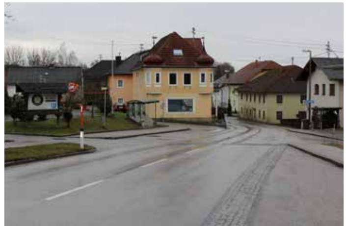
Bitte Bushaltestelle frei halten!