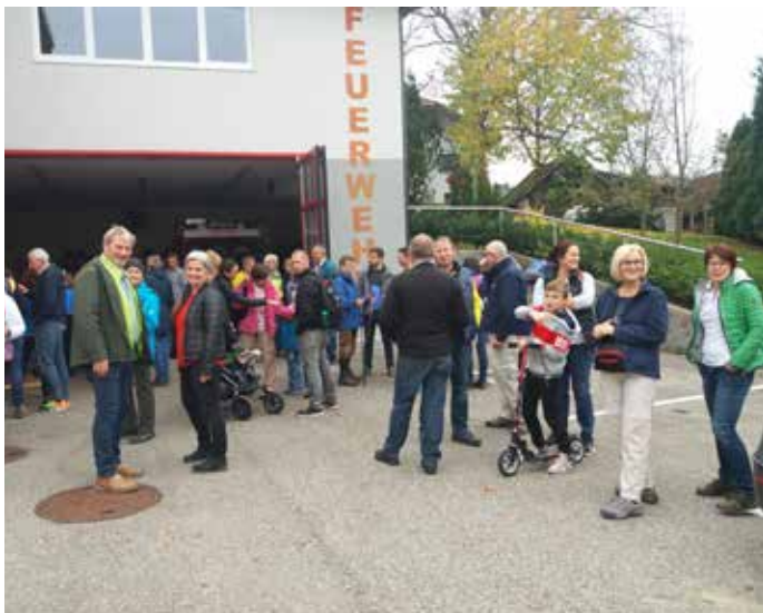
Zahlreiche Teilnehmer beim Familienwanderag 2017

Unsere Erfahrungen werden in die Organisation des nächsten Wandertages am 26.10.2018 einfließen und wir freuen uns schon wieder auf eure Wanderlust.