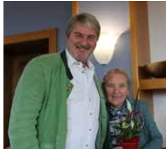
Danke an die Helfer