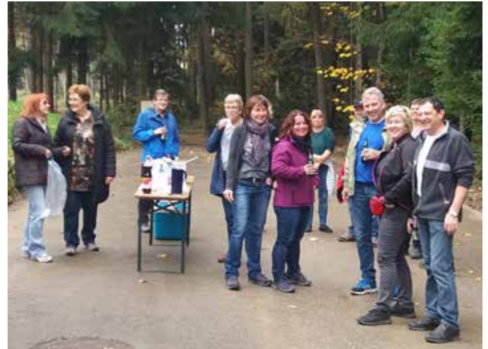
Bei der Station am Hochbehälter Vornbuch warteten Getränke auf die durstigen Wanderer