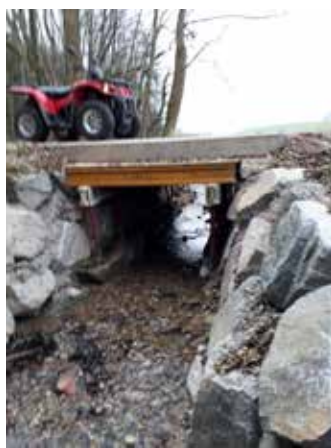
Die Brücken wurden saniert

Ein ewiges Thema war der Zustand der Brücken in Hart