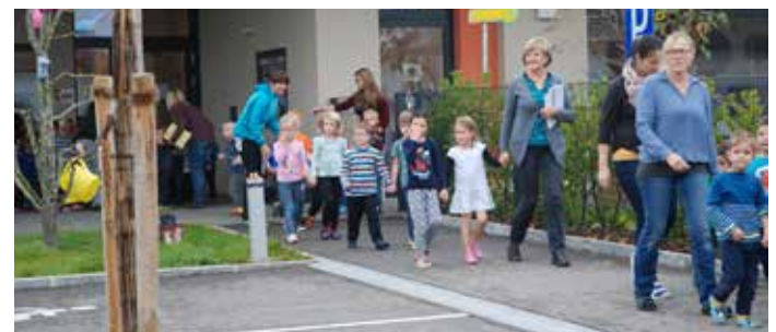
Räumungsübung im Kindergarten