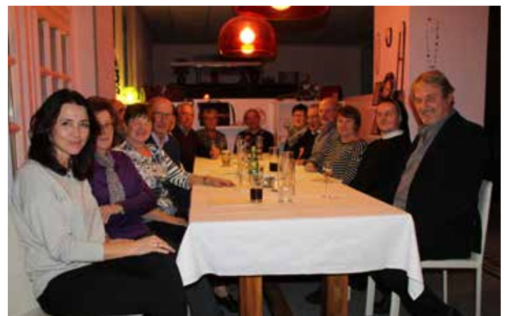
Weihnachtsfeier „Essen auf Rädern“

Als Zeichen der Wertschätzung durfte ich die Fahrerinnen und Fahrer der vom Sozialfonds ins Leben gerufenen Aktion „Essen auf Rädern“ zu einer kleinen Weihnachtsfeier