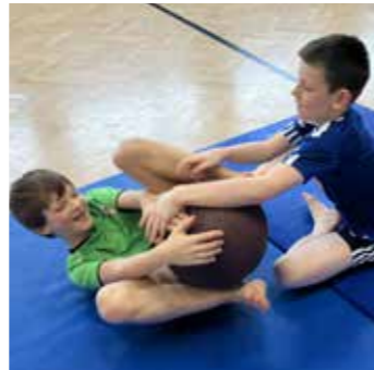
Kämpfen mit Regeln.

Die Einheit stand unter dem Motto Ringen und Kämpfen. An verschiedenen Stationen konnten die Kinder ihre Kräfte messen. Dabei kam auch das soziale Lernen nicht zu kurz, da Regeln beachtet und Rücksicht genommen werden musste.