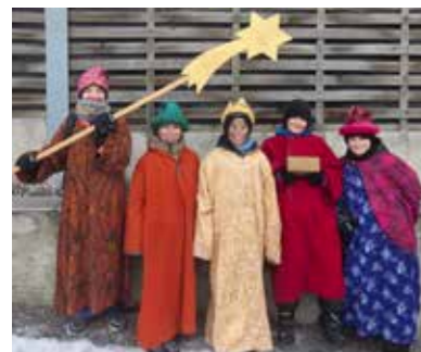
Sternsinger waren unterwegs.

Mehr als 40 engagierte Kinder sowie rund 20 Leiter/innen waren in Meggenhofen unterwegs, um den Segen in die Häuser zu bringen und Spenden für Projekte in Nepal zu sammeln.