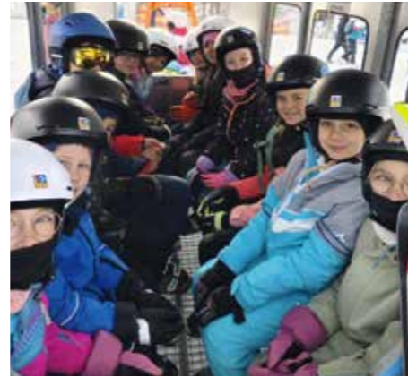
Schulskikurs auf der Wurzeralm.

Am Ende waren sich alle einig: Der Schulskikurs war auch heuer wieder ein unvergessliches Erlebnis für die Kinder.