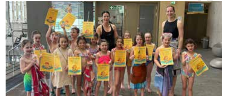
Die 1. Klasse beim Schwimmkurs.