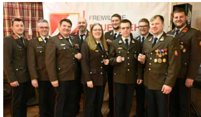
Übergabe von Leistungsabzeichen.

Neben umfassender Übungs- und Ausbildungstätigkeiten, fand man auch noch Zeit, Leistungsabzeichen zu absolvieren. 17 Abzeichen wurden in den Bereichen Atemschutz, Funk, Branddienst und Löschangriff abgelegt. 720 protokollierte Tätigkeiten (also alle Einsätze, Übungen, Ausbildungen, Veranstaltungen, ect.) fanden 2025 statt. Somit wurden im Schnitt täglich zwei Feuerwehrangelegenheiten behandelt.