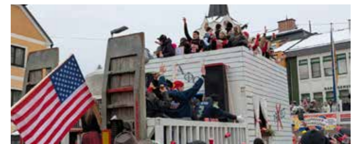
Faschingswagen der JVP und LJ.

Nach mehreren Wochen intensiver Vorbereitung und vielen lustigen Bastelabenden war es schließlich so weit: Wir nahmen an zwei Faschingsumzügen teil – am 14. Februar in Gaspoltshofen und am 15. Februar in Gallspach. Wie jedes Jahr waren es wieder zwei extrem lustige Tage mit vielen motivierten Mitgliedern, guter Stimmung und jeder Menge Spaß.