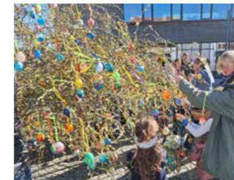
Der Baum wurde mit vielen bunten Eiern geschmückt.

Der Verein bedankt sich herzlich bei Familie Mitterlehner/Voithofer aus Schlatt für die gespendete Korkenzieherweide, bei den Bauhofmitarbeitern für die Unterstützung beim Transport sowie beim Kindergarten-Team und den Kindern für die tatkräftige Mit-