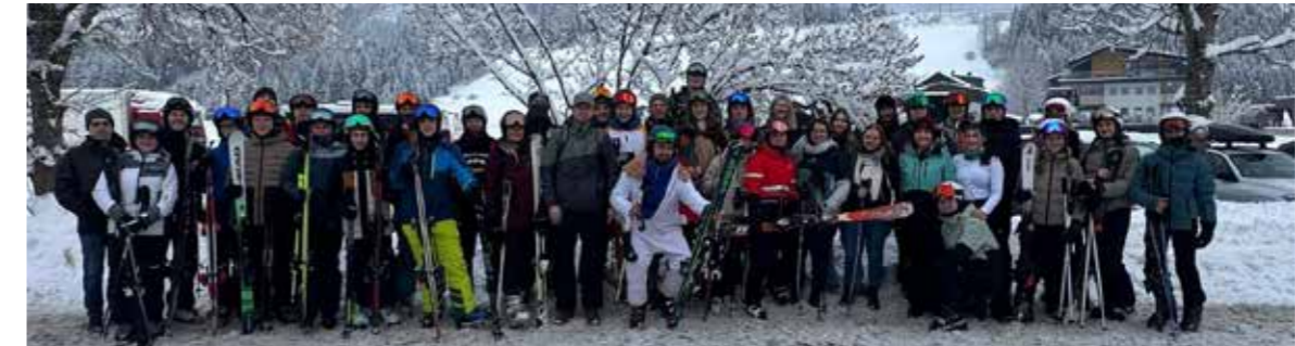
Jede Menge Spaß beim Landjugend Skitag.

viert auf den Weg ins Skigebiet. Mit dabei waren natürlich viele begeisterte Skifahrer– aber auch einige Mitglieder, die ihre Ski bewusst zu Hause gelassen haben und den Tag auf der Hütte oder beim gemütlichen Zusammensitzen genießen haben.