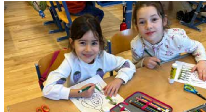
Zu Besuch in der Volksschule.