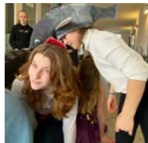
Lustige Stationen im Martinshaus

Aktivitäten wie Dosenwerfen oder Bowlen waren sehr beliebt. Auch Spiele wie „Reise nach Jerusalem“ und Twister füllten die Räume mit Lachen. Die Stationen waren nicht nur für die Kinder lustig, auch unsere Leiter und Leiterinnen hatten viel Spaß.