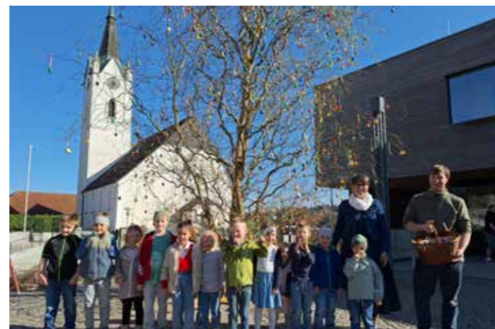
Der fertig geschmückte Osterbaum ziert unseren Dorfplatz.