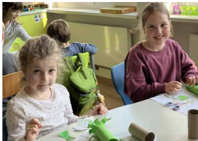
Gemeinsames Basteln mit den Schulanfängern des Kindergartens.