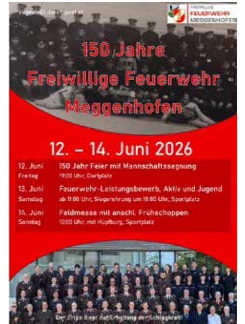
Herzliche Einladung zur Jubiläumsfeier für alle.

Vorher findet am Sonntag, den 3. Mai 2026 noch die Florianimesse mit anssl. Frühschoppen statt. Auch hierzu laden wir sehr herzlich ein.