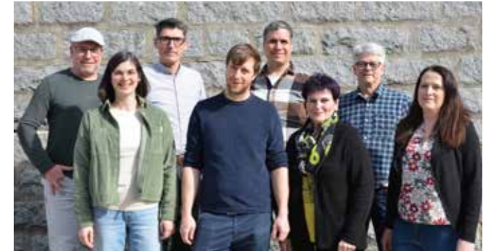
Der neue Vorstand stellt sich vor.

Mit frischem Elan und vielen neuen Ideen startet der Verein in die nächste Phase. Passend dazu zeigt sich der Verein Lebens(t)raum nun auch mit einem neuen Logo, das die Identität und die Ziele des Vereins lebendig widerspiegelt.