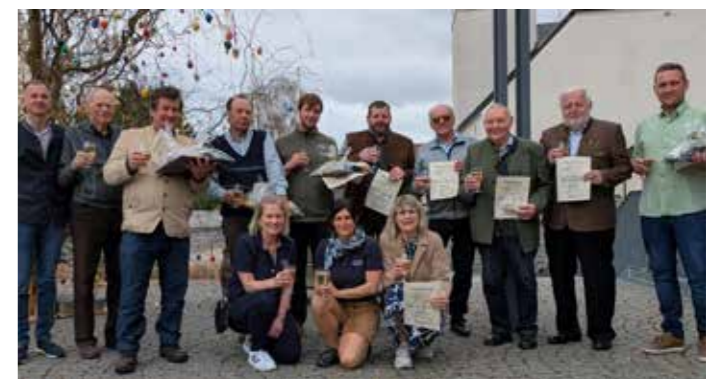
Die Gewinner der Mostverkostung mit ihren Urkunden und Geschenken.