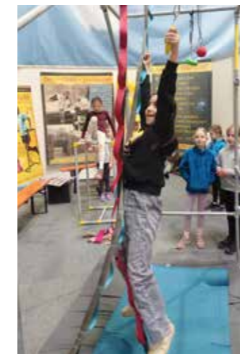
Spaß an der Bewegung!

lichkeit über Ausdauer bis Teamgeist war für alle etwas dabei. Die Schülerinnen und Schüler konnten neue Sportarten kennenlernen und ihre Fähigkeiten testen.