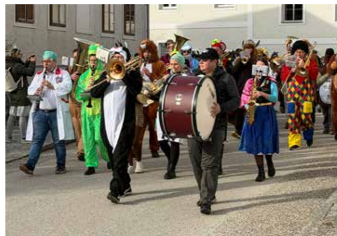
Die Musikkapelle führte den Umzug an.