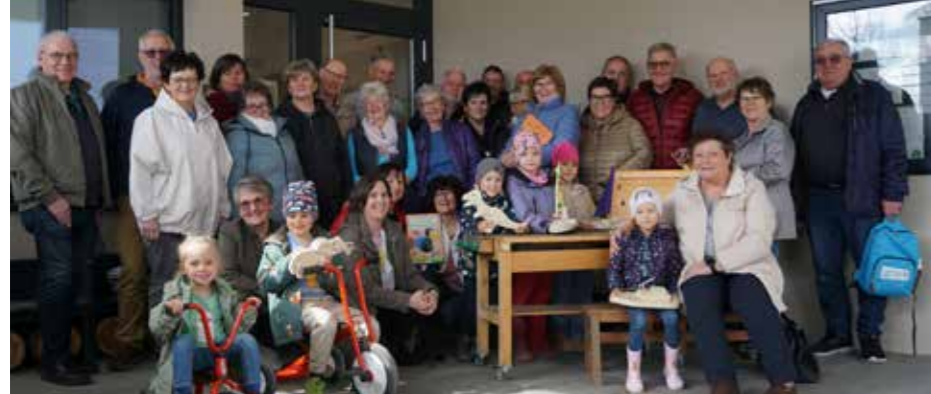
DANKE für euer Engagement!

Neben ehrenamtlichen Lese-Omas, Arbeiten mit dem Werkstatt-Opa, Werkstatt-Opa, Holzspender für die Instandhaltungs-Fachkräfte für Holz-