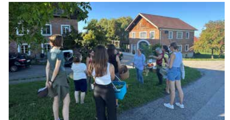
Der Umweltausschuss freut sich wieder auf viele Interessierte Teilnehmer.

Anmeldung: bei Margareta Oberndorfer 0660/39 27 999 (ab 16 Uhr)