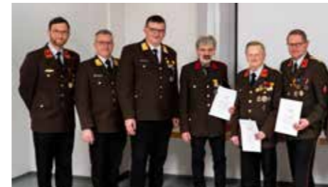
Zahlreiche Ehrungen fanden statt.