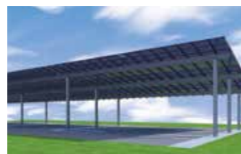
Vorentwurf PV Überdachung.

Laut Medienberichten wurde in Meggenhofen von der Firma POD der größte E Autoladepark errichtet. Um die Sonnenenergie noch besser zu nutzen, soll künftig auch am bestehenden Pendlerparkplatz eine Solaranlage installiert werden. Ich befürworte es sehr, bereits versiegelte Flächen für PV Anlagen zu verwenden. Allerdings wird es noch einige Zeit dauern, bis alle Vorgaben und Verträge geklärt sind und das Projekt umgesetzt werden kann.