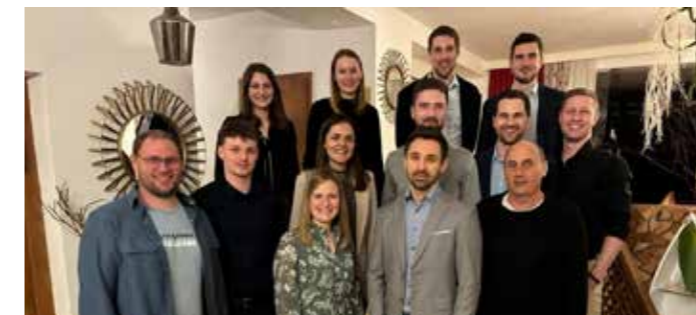
Vorstand der Sektion Fußball.