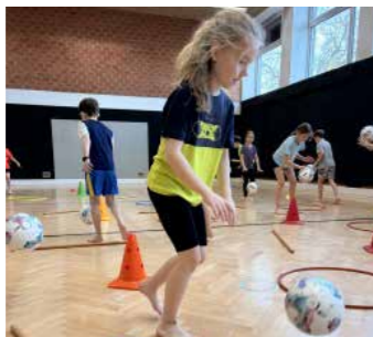
Geschick mit dem Ball.

Im Rahmen des Projekts „Schule am Ball“ konnten die Kinder ihre Fertigkeiten mit dem Ball unter Beweis stellen. Abgeschlossen wird dieses Projekt mit dem Raiffeisen Volksschulcup im Juni.