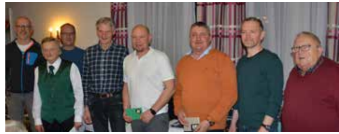
Sieger der Meggenhofner Wertung.

Nachdem die Spielleiter Roland Schäringer und Wolfgang Mair den Teilnehmern die Spielregeln erklärt hatten, und alle Unklarheiten beseitigt waren,