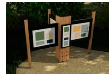
Gestaltungskonzept für eine Infotafel.

Vor vielen Jahren wurde der Natur.Spiel.Park errichtet. Viele Menschen nutzen diese Anlage zum Erholen, Entspannen und Spielen. Nun wird im Park ein sogenanntes „Wässaplatzln“ eingerichtet. Zwei weitere entstehen beim Ortsbrunnen und bei den Fisch-