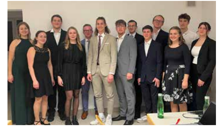
Der neue Vorstand.